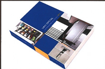
De nieuwe Van Opstal catalogus met meer dan 900 bladzijden aan meubelbeslag.