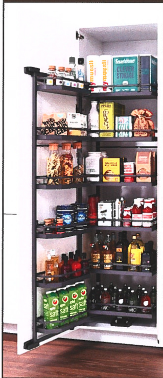
Kesseböhmer kastinrichting nu ook in moderne, warme grijsinten.

Van Opstal stelde op Prowood de laatste nieuwe trends in meubelbeslag voor. Wie het evenement gemist heeft, kan de nieuwste editie van de catalogus opragen. Op meer dan 900 bladzijden wordt het enorme aanbod aan meubelbeslag voorgesteld.